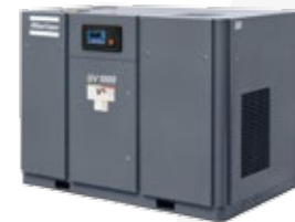
GHS 630-4800 DE TORNILLO ROTATIVO