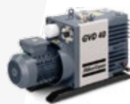
GVD 40-275 DE PALETAS DOBLE ETAPA