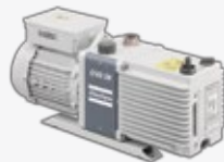
GVD 0.7-28 DE PALETAS DOBLE ETAPA