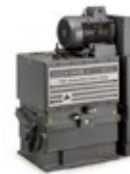
GLS 250-500 PISTÓN ROTATIVO