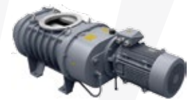
ZRS 250-4200 BOOSTER MECÁNICAS